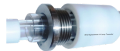
Water proof base

DBS - 04011 Adaptation to lamps with Quartz glass